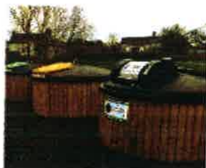
Ex : conteneurs semi-enterrés

Pendant le marché de gestion des déchets à venir, les élus de Forez-Est ont validé le développement progressif de la collecte des Ordures Ménagères résiduelles en apport volontaire par la mise en place de conteneurs aériens, semi-enterrés, ou enterrés dans les centre-bourgs, sous conditions à définir .