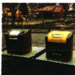
Ex : conteneurs enterrés