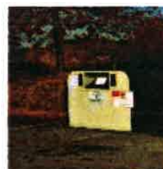
Ex : conteneurs aériens

La CCFE possède un marché pour la fourniture et la pose de ces 3 types de contenants (hors étude d'implantation et terrassement).